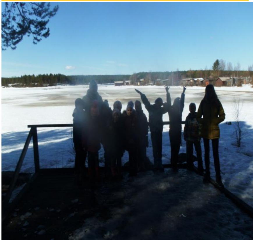
Любимое место фотосессий